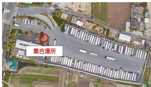
大阪トラックステーション（大阪TS）