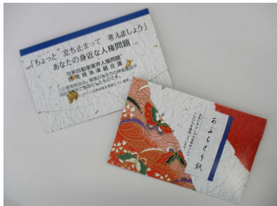
当日配布予定のあぶらとり紙