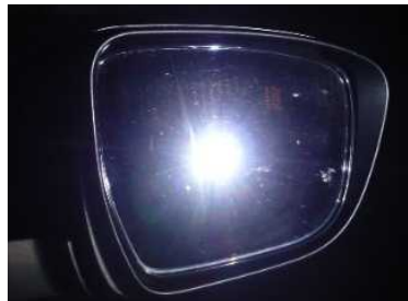
バックミラーに映るまぶしいロービーム