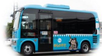
市内循環バス 「ゆらのすけ」