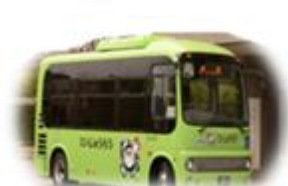
圏域バス 「ていじゅうろう」