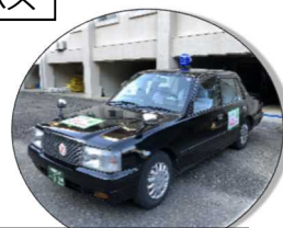
熊野川町 デマンドタクシー