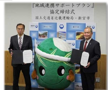
令和2年11月26日 協定書締結式