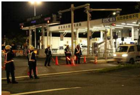
無車検車街頭検査 (夜間)