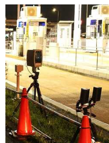
ナンバー読取装置 (夜間用)