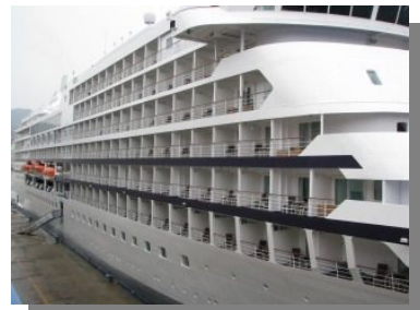
全室海側スイートルーム仕様