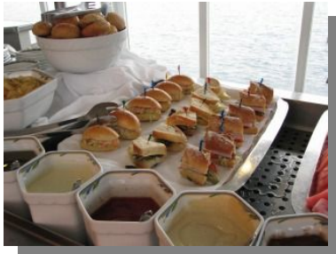
ランチ時に用意されたサンド類