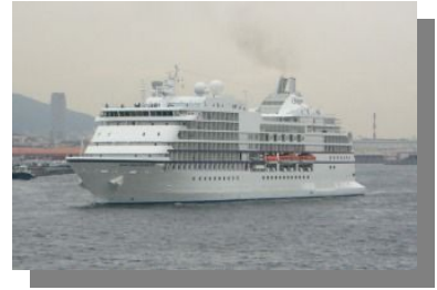
4 突旅客ターミナルに入港

2011 年の本船のクルーズ予定は、1~4 月はカリブ海・バハマ、5~9 月はアラスカ、10 月はカナダ・ニューイングランド、11~12 月はカリブ海・バハマで、日本寄港の予定はありません。ちなみに、気になるクルーズ料金の方は、アラスカクルーズ 7 泊の場合で 3,899 ドル、一日あたり 557 ドルです。みなさん、いかがですか。