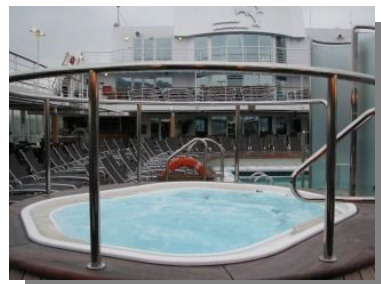
大きなジャクジー