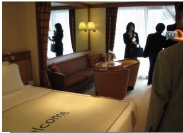
基本 28 m 2 のゆったりした客室

船内は、クルーズ客が立ち入ることができるデッキが 8 層あり、プールのあるデッキは上から数えて 3 層目となります。全体的に明るめのブラウン色を基調に上質な素材でゆったりとした空間に包まれており、クルーズ船の世界ではトップグレードの「ラグジュアリー」に該当する船らしく、どこにいても落ち着ける雰囲気があります。