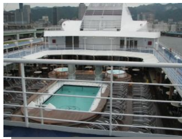
プールサイドのデッキで食事 OK