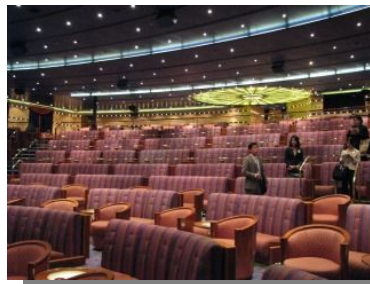
ショーなどをたのしむシアター