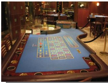
社交場でもあるカジノコーナー