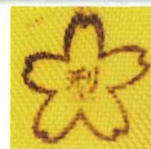
桜マーク (記載場所や内容については、販売者に確認してください。)