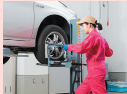
タイヤリフターによる省力化