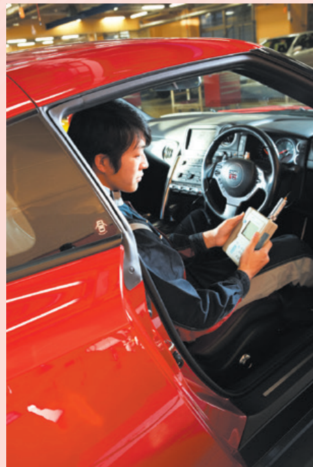
スキャンツールによる電子的な点検・整備