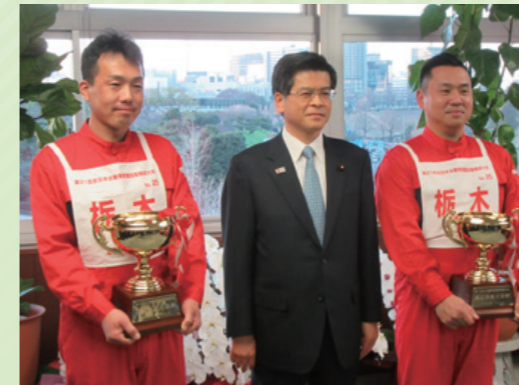
大会優勝で国土交通大臣より表彰