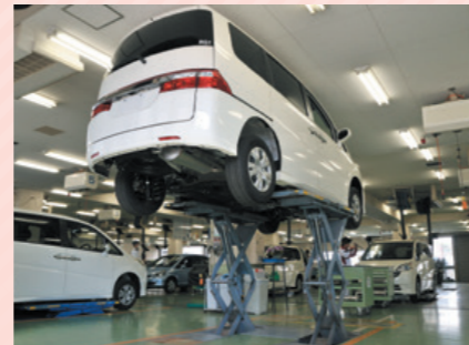
整備作業環境の整理による清潔化