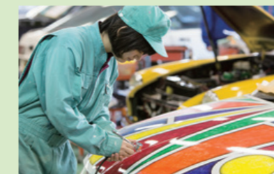
ボディカスタマイズ