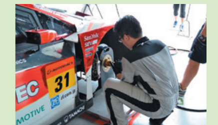
レースメカニック