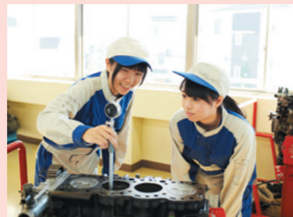
整備士を養成する専門学校の授業風景