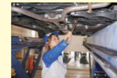
山口県 A さん 女性

整備士になって良かったと思うことは、色々な車をみたり、触れたりできることです。また、お客様の車を整備しお渡しする時にお礼を言われたり、女性のお客様から、かっこいいね!頑張ってるね!と激励を頂いた時に、自信もついて、やりがいも感じます。