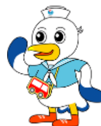
神戸運輸監理部マスコットキャラクター

年始からあっという間に1か月が経ちました。 皆さんは新春をどのように迎えられましたか？ こうべえは初詣に行きました＊ この1年も皆さんにとって素敵な一年になりますように！