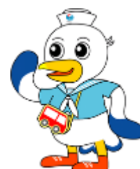
神戸運輸監理部マスコットキャラクター「こうべえ」