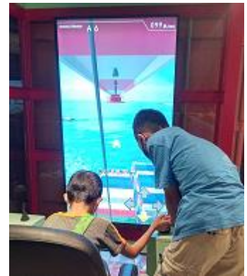
ガントリークレーンシミュレーター