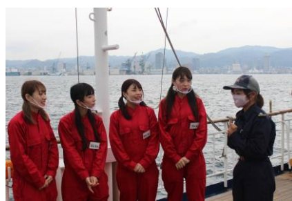
乗組員ナミさんへのインタビュー

内容は、神戸運輸監理部のC to Sea ご当地アンバサダー KRD8のメンバーが「みらいへ」に乗船し、海技士の資格について質問したり、6級海技士養成コースについてご紹介していただきながら実際に訓練を体験したり、実習生や航海士へのインタビューをするものです。