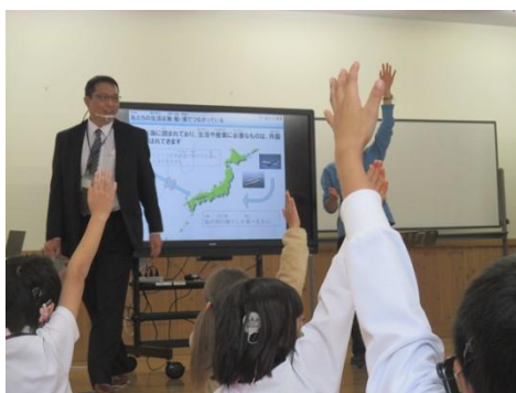
積極的にクイズに参加

子どもたちに興味を持ってもらうため、途中クイズを取り入れながら進めました。たとえば、「小麦は、外国産と日本産どちらが多いですか」という問いでは、ほとんどの子供が外国産に手を上げ、正解。続いて、「肉は外国産と日本産どちらかな？」については、答えは半々。実際は少し国産が多いというデータなのですが、エサである、飼料（トウモロコシ）が100%輸入であることを説明し、それを考慮すると自給率7%になると言うと言った驚きの反応が見られました。