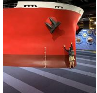
カワサキワールドにも船舶の展示