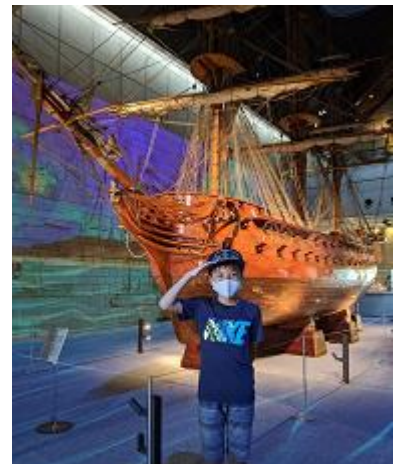
神戸海事広報大使にも参加 いただきました

今後たくさんの方々、とりわけ未来を担う子ども達に船や港に興味をもってもらうために、広く海の魅力を伝えていきたいと考えています。