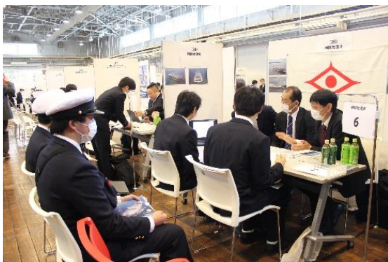
写真は令和元年度開催のセミナーの様子

※新型コロナウイルスの感染拡大や、それに伴う社会情勢の動向の変化により、開催延期・中止となる可能性があります。