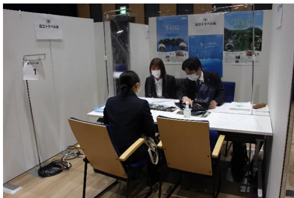
写真は令和3年度開催のセミナーの様子

※新型コロナウイルスの感染拡大や、それに伴う社会情勢の動向の変化により、開催延期・中止となる可能性があります。