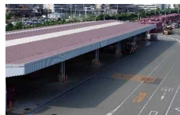
吹田貨物ターミナル駅と上屋