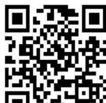
神戸運輸監理部ホームページ