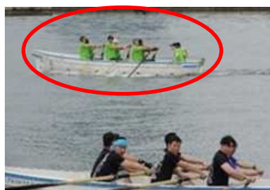
写真奥が一勝懸命漕がん会

レース当日は、風は微風ながら昼から「雨」予報でしたが、コロナ禍で去年は4年ぶり開催となったものの、密を避けるため各チーム1回のタイムで順位を決定するタイムレース方式でしたが、今年本来のトーナメント方式ということもあり、各チームとも応援にも熱が入り大いに盛り上がりました。