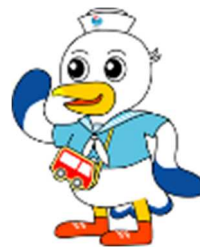
神戸運輸監理部マスコットキャラクター「こうべえ」

神戸港は、帆船を長く見ることができました。6月に入ってから入港予定があります。岸壁はもちろん、遊覧船、メリケンパーク、ポートタワーからも見ることもできます。是非この機会に見てみませんか。