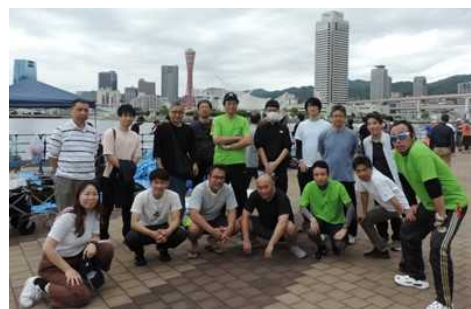
（神戸運輸監理部職員チーム 一勝懸命漕がん会）

神戸運輸監理部では、これからも職員同士の交流はもとより、神戸港で働く人たちや市民と親しみやすい港づくりに貢献できるよう、取り組んでいきます。