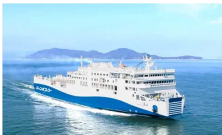
ジャンボフェリー「あおい」

2022年10月に就航したジャンボフェリーの新船「あおい」の普段は入れない船内を見学するバックヤードツアーや、船や港について学ぶ特別授業、船乗りには欠かせないロープワーク教室など、イベントが盛りだくさん。参加費は無料ですので、多くの皆様からのご応募をお待ちしております。