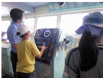
バックヤードツアー(ブリッジ)