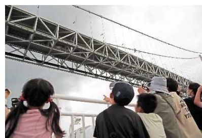
明石海峡大橋下を通過！