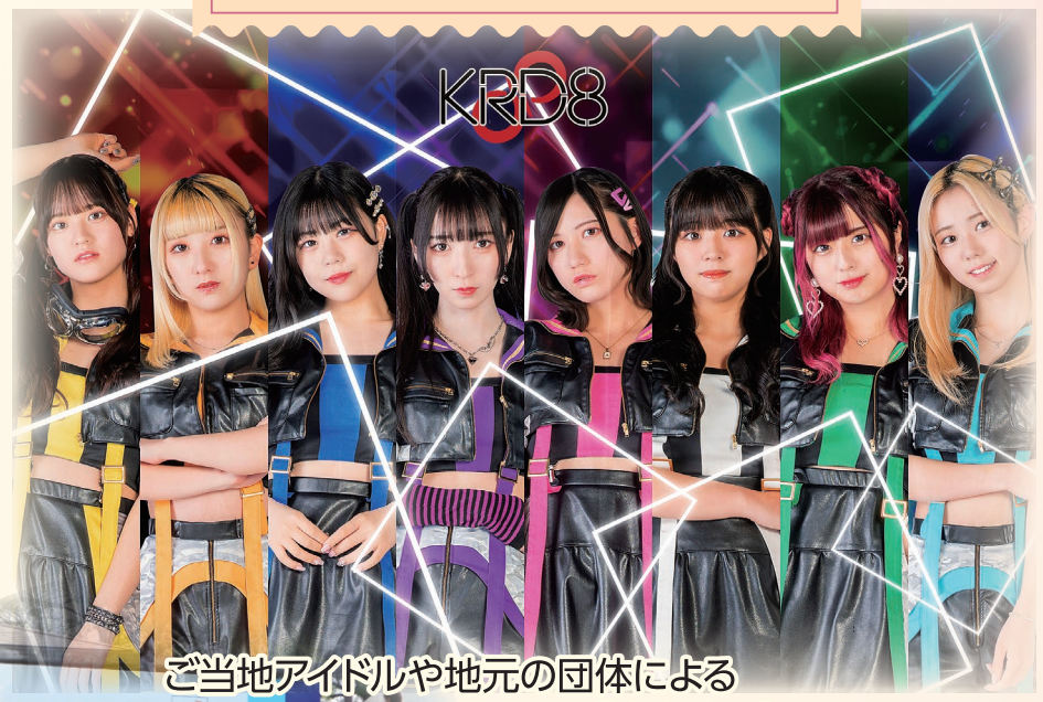
ご当地アイドルや地元の団体による ステージ演奏 など (8団体程度)