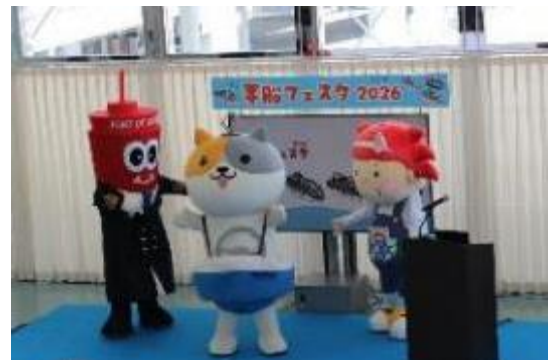
ステージで歓声を浴びる「のりたろう」

ステージイベントの「オープニング」と「ゆるきゃらグリーティング」では、神戸港PRキャラクター「キャプテンタワー君」（写真左）、金沢海の幸PRキャラクター「さかなざわさちこ」さん（写真右）とともにステージに登壇し、来場者とのふれあいをとおして会場を盛り上げました。