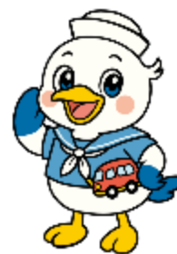
神戸運輸監理部イメージキャラクター 「こうべえ」

新年度が始まりましたね 新しい環境で頑張るみなさんも多いのでは？ リフレッシュしたくなったら・・・ 4月10日（金）～13日（日） 『関西ボートショー2026』新西宮ヨットハーバーへ https://kansai-boatshow.jp/ ボートの体験乗船のほか、 海や船に親しめるブースも多数出展しています！ 神戸運輸監理部も準備中です