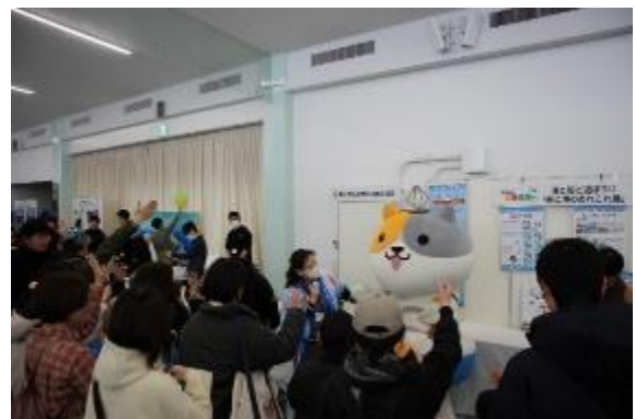
来場者とゲームを行う「のりたろう」

配布していた缶バッジは好評のため早々になくなりました。そこで、「のりたろう」とゲームをする企画を急ぎよ実施し、サンプルで作成していた缶バッジを景品として大放出！「のりたろう」には船・鉄道・自動車・飛行機の要素が含まれていることを紹介すると、多くの来場者が興味深く話に耳を傾けていました。初めて「のりたろう」を知ったという方も多かったようですが、しっかり記憶に残っていただけではないかと思えます。