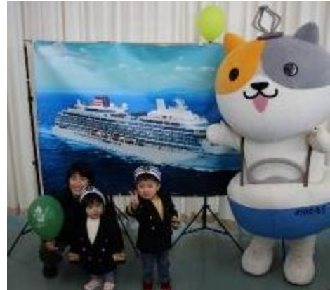
船長服が似合っています 📷

さらに、今年は、国土交通省公共交通利用促進キャラクター「のりたろう」が登場し、一緒に写真撮影を希望する方が絶えない人気ぶりでした。