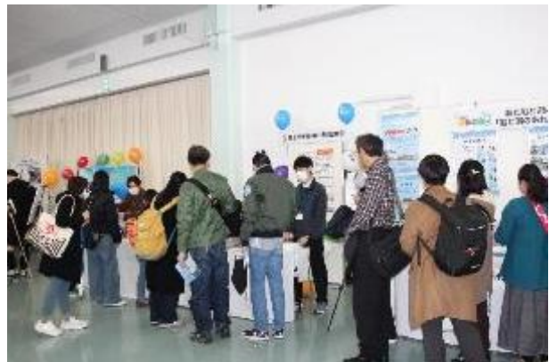
監理部ブースも大盛況

神戸運輸監理部の海事PRブースでは、海事観光について紹介するパンフレット・クリアファイル・ノートなどがたくさん入ったPRエコバッグや、缶バッジ・風船を配布したほか、船長服を着用し飛鳥Ⅲと一緒に写真を撮影できるフォトコーナーを設置し、約1,000名の方にお越しいただきました。