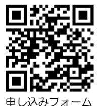
申し込みフォーム

神戸運輸監理部海上安全環境部船舶安全環境課 筒井・今川 電話 (078) 321-7052 メール kbm-ankan@gxb.mlit.go.jp