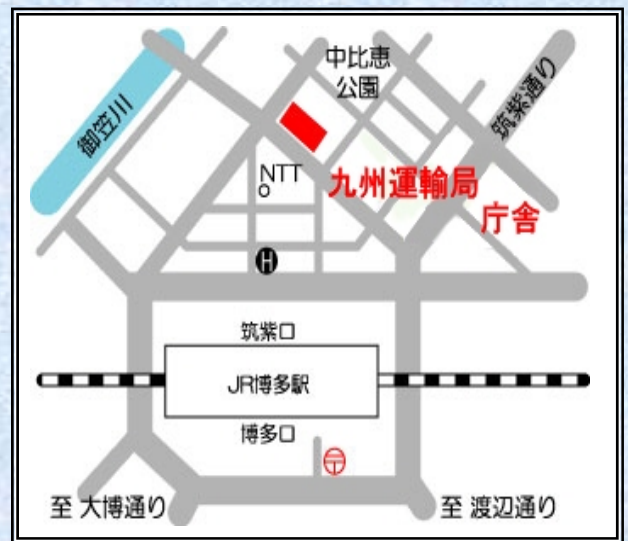
船員就業フェア会場案内図