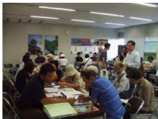
平成20年8月2日 福岡説明会