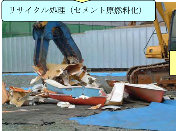
リサイクル処理（セメント原燃料化）