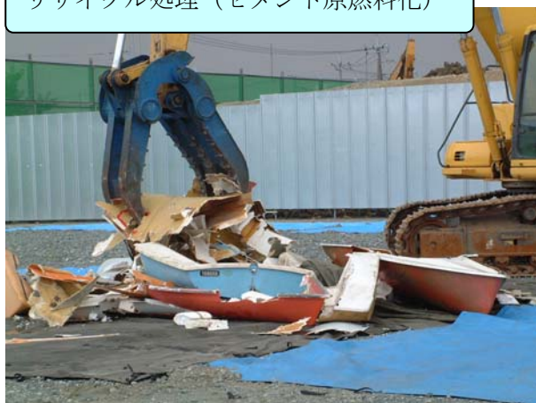
リサイクル処理（セメント原燃料化）