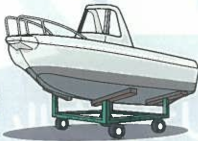
③その他（一時保管、下架料金等）