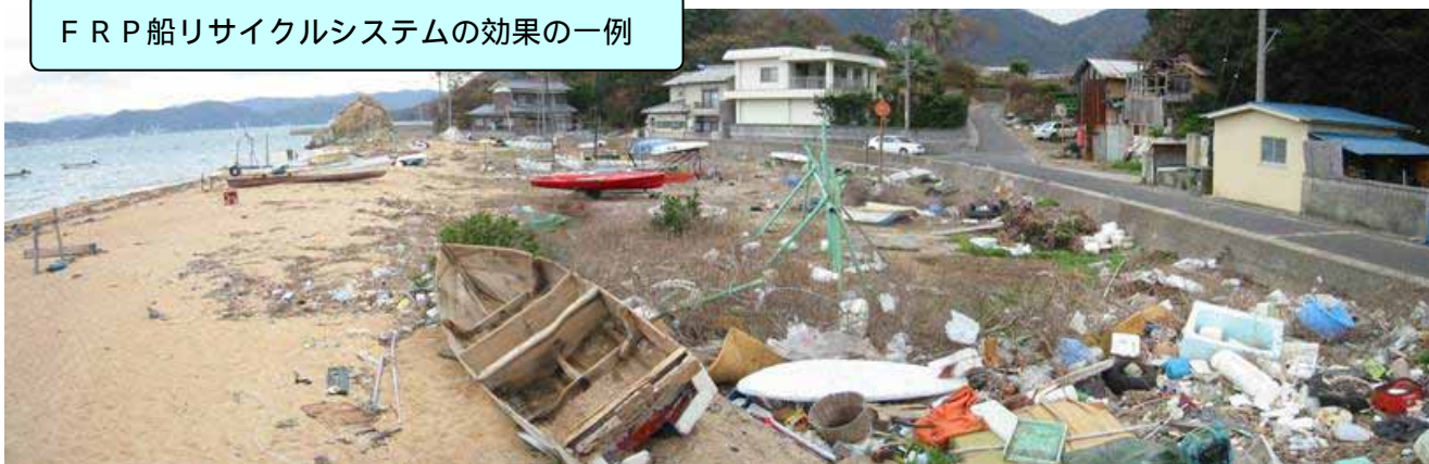
FRP船リサイクルシステムの効果の一例

【(社)日本舟艇工業会】 http://www.marine-jbia.or.jp/recycle/