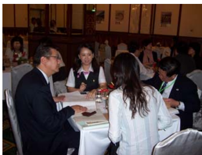
ウェルカム九州フェア等実施事業(分類3) 台湾での観光説明会・商談会での風景(5/14)