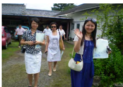
西都市農家民宿視察風景（6/26）

上海地区の修学旅行の誘致拡大に向けて、九州の雄大な自然、先進的な環境保護関連施設等、教育旅行に相応しい資源を直接視察してもらうため、教育旅行先の決定に強い権限を持つ、上海地区の学校長及び教育関係者を招聘。