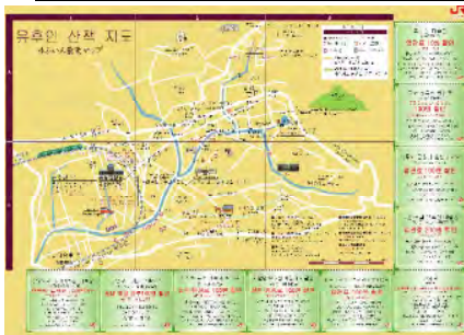
街歩きマップ（イメージ）

インターネット環境の整った韓国の個人旅行者（FIT）をターゲットに、九州内の鉄道沿線をメインとして、主要観光地やグルメ、ショッピングなどの情報並びに、特典クーポンを付与した「街歩きマップ」を9月末までに制作し、JR九州等観光関係者のHP上に掲載する予定です。ダウンロードすることにより実際の旅行の際に携行できる、携行性、利便性に優れたツールとすることで、九州への旅行意欲の醸成とリピーター増加を目指します。