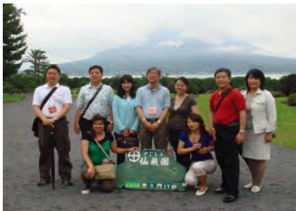
鹿児島県仙巖園での記念撮影(6/17)

6月19日、20日、横浜市のパシフィコ横浜において開催される国内最大級のインバウンド商談会「YOKOSO! JAPAN トラベルマート2008春」の一環として、商談会直前の6月15日～18日に、同商談会の参加者のうち九州向けツアー造成に意欲的なバイヤーを九州へ招聘。