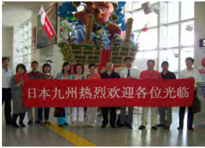
福岡空港での記念撮影(7/9)

中国では、修学旅行の意義・目的などがまだ十分に理解されていない部分が多いため、修学旅行の必要性を理解してもらい、更なる誘客促進を図るために、中国の有力マスコミ関係者を招聘。