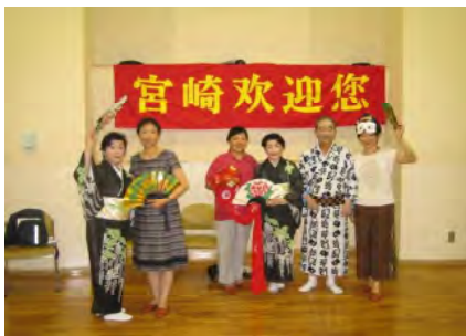
日本舞踊団体との交流(6/25)

これまで中国からの老人団体の誘客には、太極拳をはじめとするスポーツ交流が大きな成果をあげてきたが、さらなる誘客の積み上げを行うためには、新しい交流テーマによる誘致活動が必要不可欠なため、北京市の中老年団体文化交流に強い影響力を持つ中国老齡事業發展基金会等のキーマンを招聘。