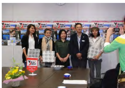
九州運輸局表敬訪問（6/24）

九州にとって東アジアに次ぐ重点マーケットであるタイ国の国民的スターと女優を含む雑誌撮影クルーを招聘。