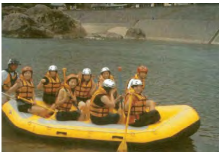
ラフティング体験（イメージ） の観光資源の紹介等を行います。

招聘コースは福岡空港～宮崎県～鹿児島県～福岡空港で、各県2泊の予定です。また、南九州旅行商品を企画販売するための広告を制作する場合に、その制作費の支援も行うことで、商品の造成及び販売促進に繋がります。