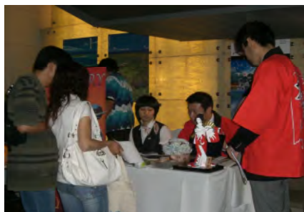
富裕層に対する個別説明風景（6/28）

本年3月に中国における家族観光ビザの発給開始に伴い、富裕層の小人数での旅行増加を見込み、北京市内の超高級マンションにおいて北京市及び周辺地区の高級車、高級マンション所有者などを対象とした、日本向けツアー促進イベントへ参加。