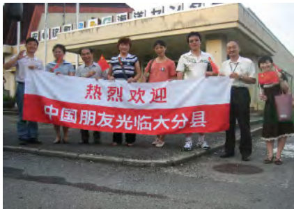
大分県安心院での記念撮影(7/7)

中国無錫地区から九州へ来訪する青少年団体ツアーに帯同するかたちで、教育関係者や中国最大規模の子供新聞を発行している新聞学校の学校長を招聘。