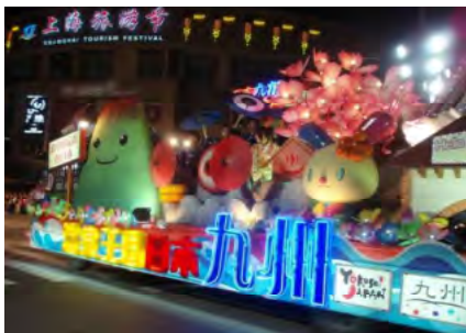
「動感効果賞」を受賞した昨年の九州花車

第一次団体観光ビザ解禁地域である上海市、広東省において全市(省)をあげて開催される観光フェスティバルに参加。