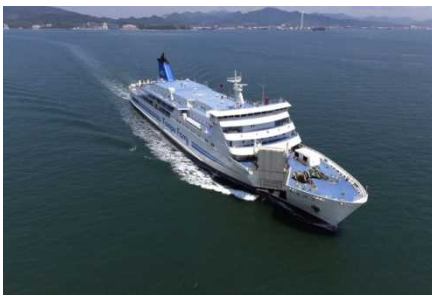
はまゆう(下関～釜山航路)