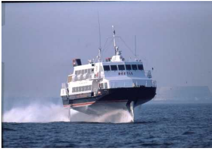
ビートル(博多・対馬～釜山航路)

博多・対馬・下関と韓国の釜山を結ぶ日韓航路は、年間133万人の利用がある重要な航路となっており、なかでも近年においては、対馬航路の伸びが顕著となっています。