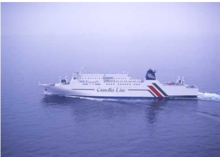
ニューかめりあ(博多～釜山航路)