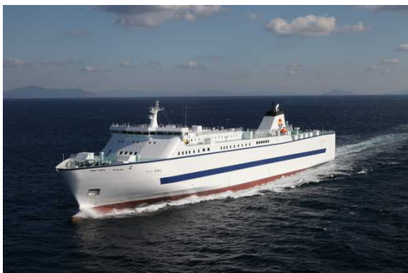
フェリーびざん(北九州～徳島～東京航路)