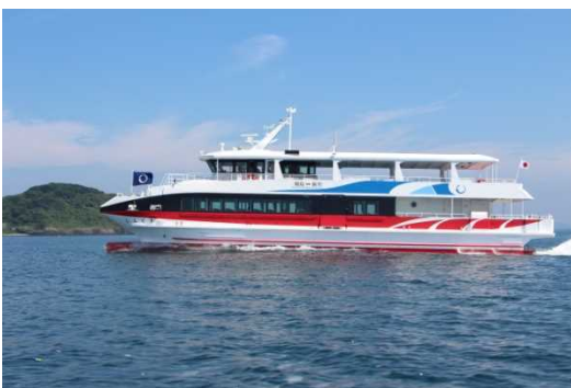
しんぐう(相島～新宮航路)