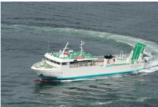
フェリーくろしま(黒島～高島～相浦航路)