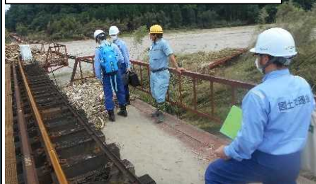
球磨川第4橋りょう(湯前駅方)の調査