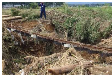
川村駅～球磨川第4橋りょうの調査