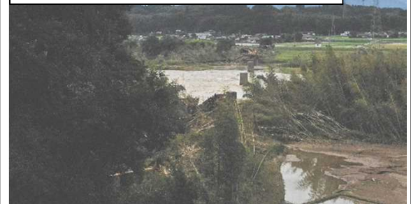
ドローンによる川村駅の空撮