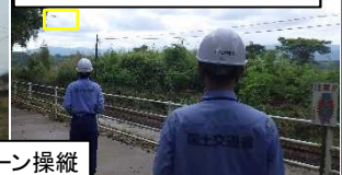
球磨川第4橋りょう(湯前方)