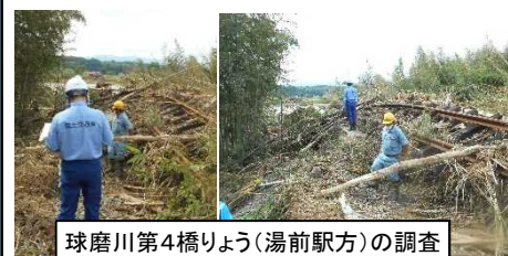
球磨川第4橋りょう(湯前駅方)の調査