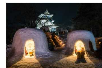
地域ならではの文化、建造物、風景