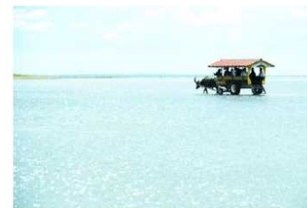
この場所ならではの風景