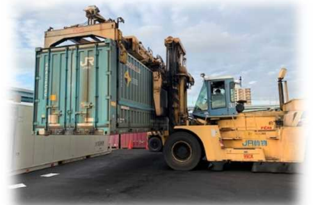
トップリフターによる荷役の様子