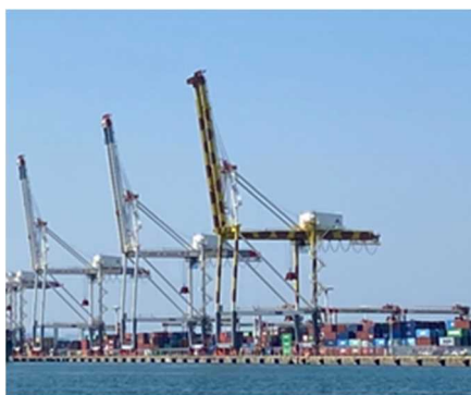
キリン柄に塗装されたガントリークレーン

※2：港湾運送事業者とは、指定港湾において船積貨物の積卸し、上屋その他荷さばき場への搬出入及び一時保管を行う事業者です。