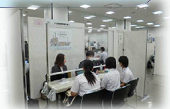
(写真は、昨年の会場の様子)