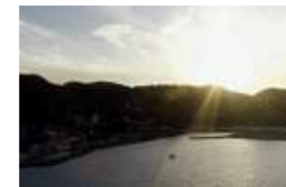
サンセットクルージング