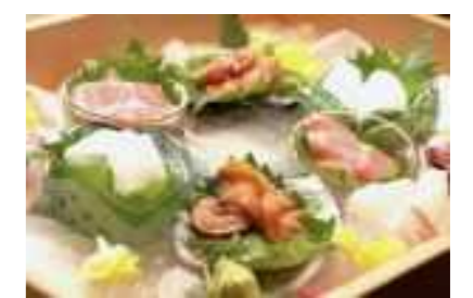
ダイニング・バーホッピング