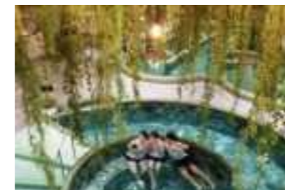
温泉ナイトリラクゼーション