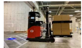
無人フォークリフト