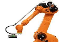
ピッキングロボット