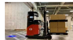
無人フォークリフト