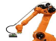
ピッキングロボット