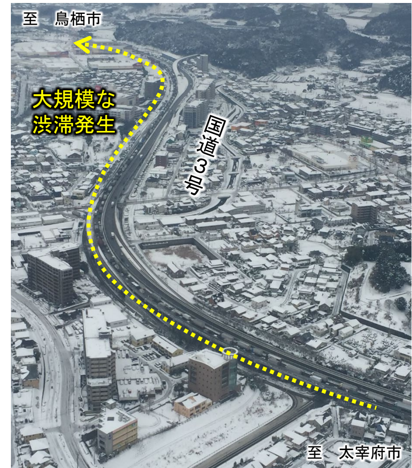
▲国道3号の渋滞状況(福岡県筑紫野市上空)