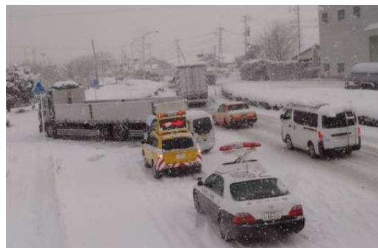
▲立ち往生車両の発生状況 (鳥栖市)