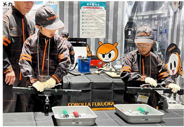
【株式会社ホンダモビリティ九州 様】