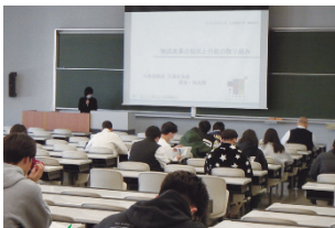
大学生に倉庫・物流業の役割や魅力を伝える物流講座