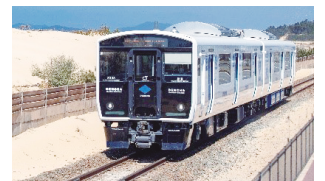
香椎線・819系 DENCHA (JR九州)