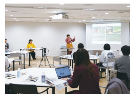
女性のための宿泊業セミナー