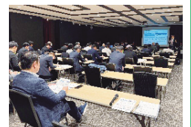
「宿泊業における生産性向上」に関する勉強会