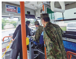
自衛隊と連携した説明体験会