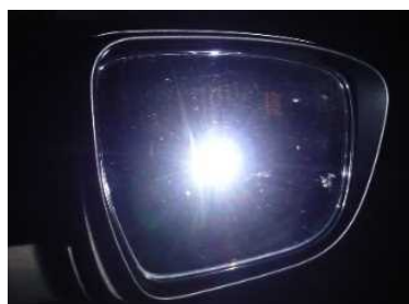
バックミラーに映るまぶしいロービーム