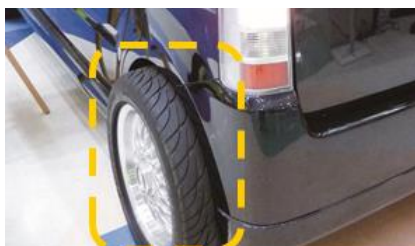
車体からはみ出すホイール

車体外にはみ出すタイヤの装着や違法マフラーの装着などの不正改造車を公道から排除するため、警察機関、独立行政法人自動車技術総合機構、軽自動車検査協会等と連携した街頭検査を実施し、違反車両に対して整備命令を発令するなど、厳正に対処します。