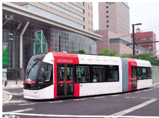
低床式車両の導入

地域公共交通活性化・再生法の総合連携計画に基づく軌道運送高度化事業に対して補助率を1/3に嵩上げ