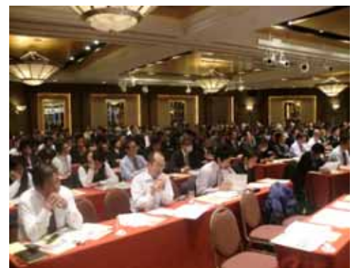
熱心に聞き入る参加者