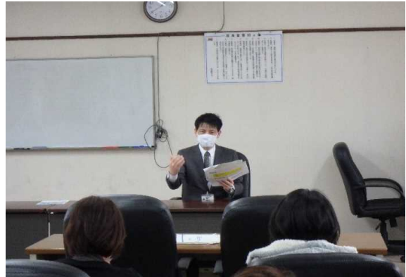
当事務所船員担当からは、一括届出 就業規則等について身振り手振りを交え説明。