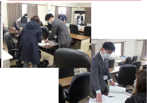
説明会後はさっそく質問・個別説明が！！ 届出書のデータがほしいとの声もあがり 当日送付しました！