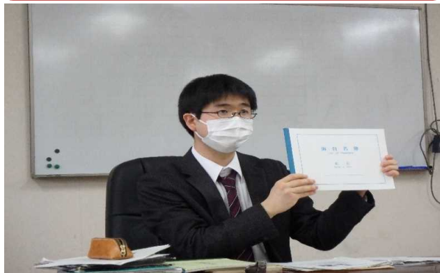
運航労務監理官から船内に備える書類について説明。 海員名簿等を用意し、視覚的にもわかりやすく。