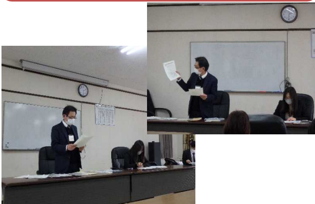
佐世保年金事務所による船員保険の説明、簡潔に まとめられた資料を基に船員保険について解説。