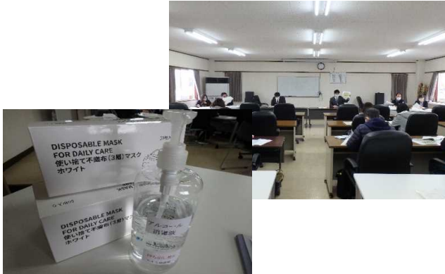
受付に消毒液とマスクを置き、感染対策。 説明中は窓を解放、風通しのいい説明会場に。