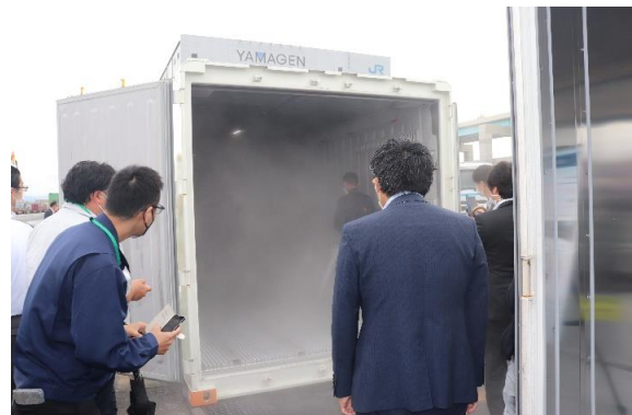
温度を一定に保つ 遠隔監視制御システム搭載コンテナ