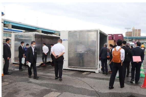
安全面に十分配慮したうえで見学を行います