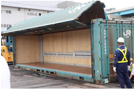
31ftウイングコンテナ