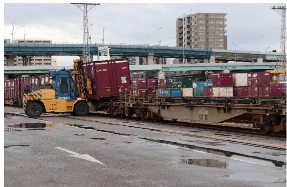
フォークリフトで荷役します