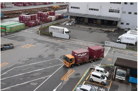
トラックで運ばれたコンテナ