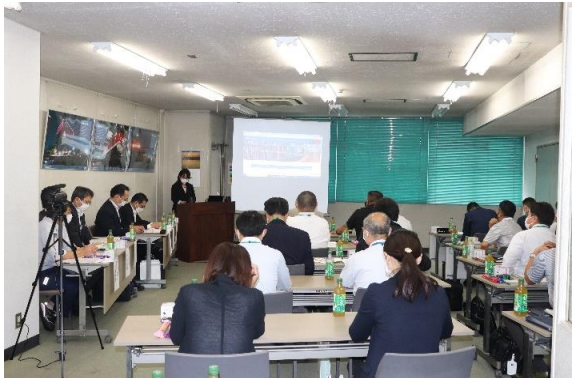
募集定員満員の参加者