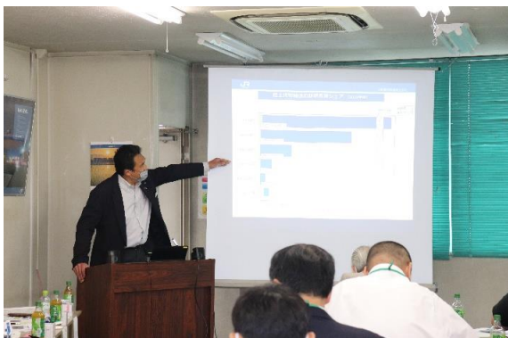
日本貨物鉄道による講義