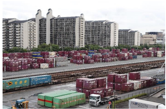
福岡貨物ターミナル駅 構内