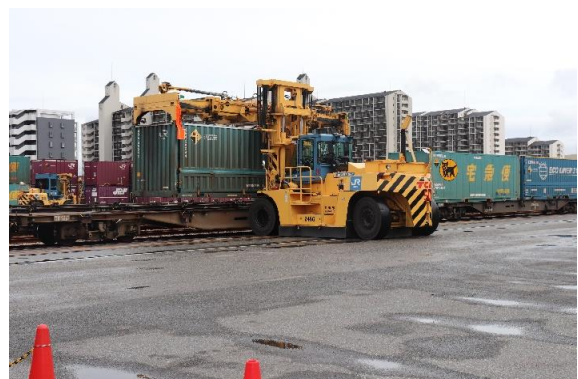
トップリフターによる荷役の様子