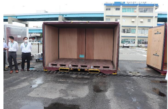
用途に応じて様々なコンテナがあります