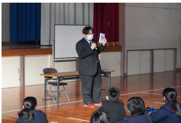
大島商船高等専門学校出前講座

各地で海事産業見学会を実施 ～海事産業の将来を担う人材育成に向けて～ 【11月10日】北九州市石峯中学校