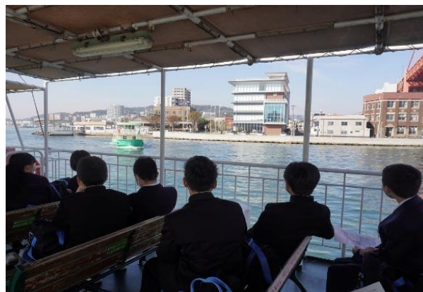
船から眺める鶴丸海運(株)の社屋

学校の概要と航海に必要な海図についてや、古から日本と海外との間を船で往来していたことなど航海の歴史について説明を受けました。