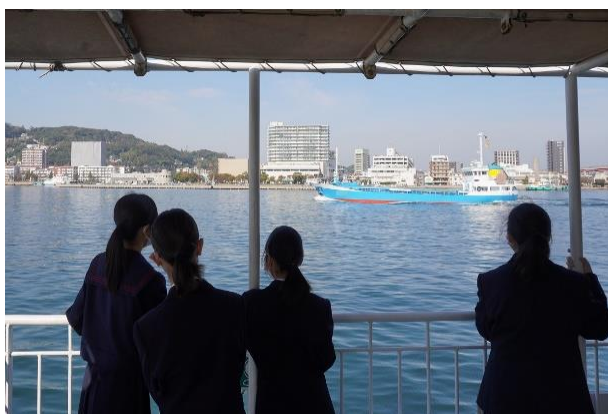
航行する内航貨物船