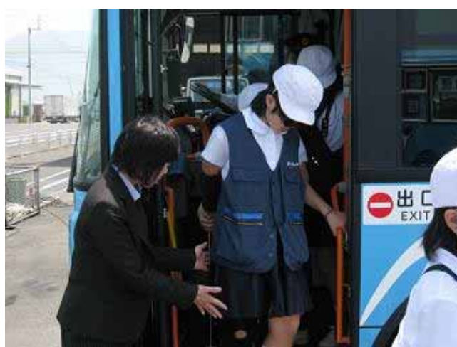
シニアポーズを装着した友達を介助しながら乗降