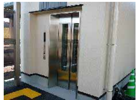
土佐くろしお鉄道 中村駅のエレベーター

みなさんからのご意見・ご投稿をお待ちしています。バリアフリーに関するものならなんでも結構です。四国運輸局消費者行政課まで、FAXまたはメールでお寄せ下さい。