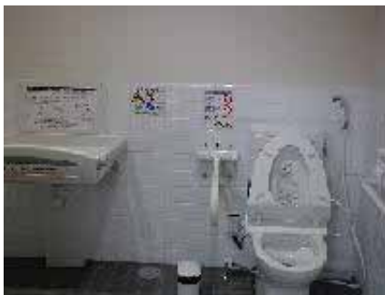
高松琴平電気鉄道 三条駅のトイレ