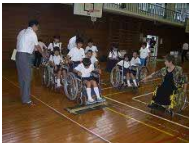
講師の指示で車いす体験