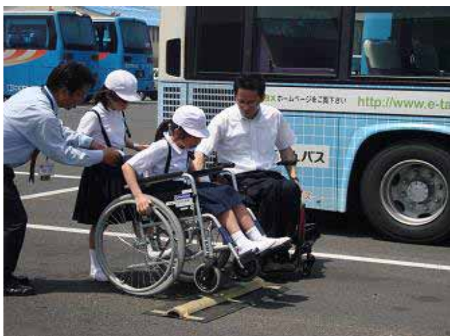
段差を車いすで慎重に通過

参加した児童は、講師の話の聞いたり、実際に介助体験をすることによって、相手を思いやり相手の立場にたって行動することの大切さを学びました。