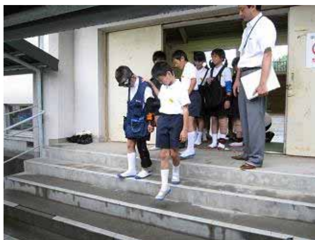
シニアポーズを装着した友達を介助