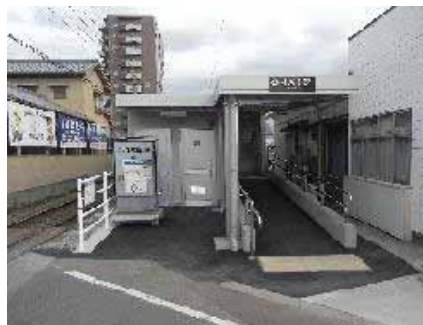
伊予鉄道 福音寺駅のスロープ