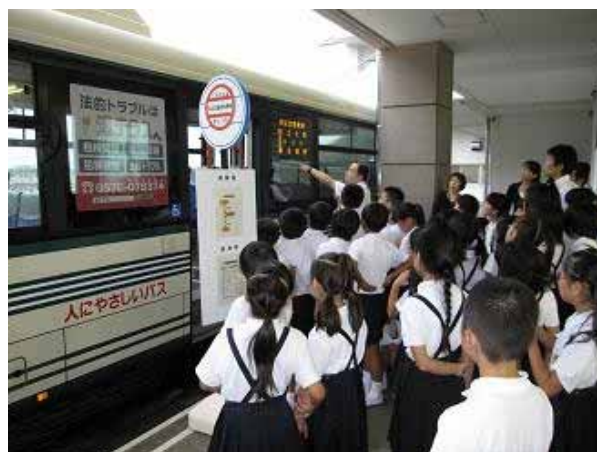
バスの乗り方を学習