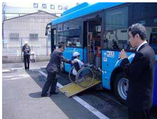
車いすのままバスに乗降

バリアフリーに対応した低床バス車両の特徴を、通常のバスと比較して学習したり、低床バスに乗降する車いす利用者の介助の仕方を間近で見学しました。